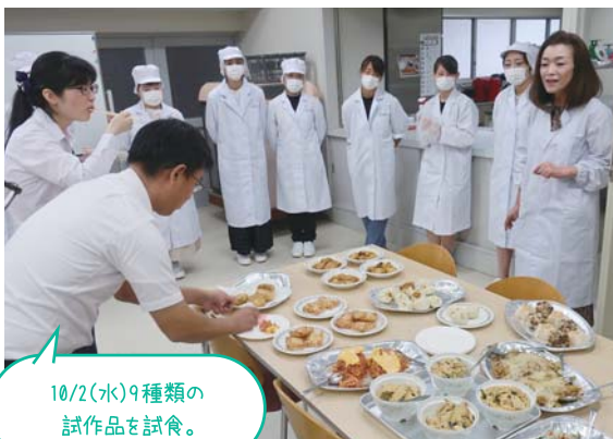
10/2(水)9種類の 試作品を試食。