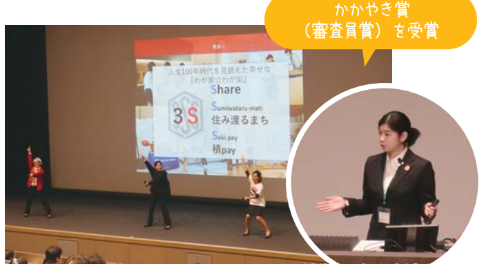
かがやき賞 (審査員賞)を受賞