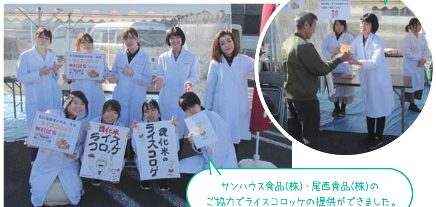
サンハウス食品(株)・尾西食品(株)の ご協力でライスコロケの提供ができました。