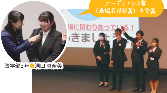
オーディエンス賞 (来場者投票賞)を受賞

あいちの「人づくり」プロジェクトとして、愛知県が開設する「かがやけ☆あいちサスティナ研究所」。学生がグローバルな視点でエコアクションを継続しています。第5期生として本学からは2名が研究員として参加しました。6/30(日)開所式以降、パートナー企業からの課題に対し他大学の学生とともに研究し、成果発表会で解決策を発表しました。