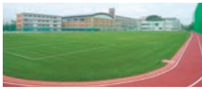
人工芝の新グラウンド

七月十九日、名古屋市瑞穂区高田町の愛知県立大学跡地で、名古屋経済大学高蔵高等学校・中学校の竣工式を行いました。高蔵高等学校・中学校は熱田区から移転、九月一日より新校舎で授業が開始されました。