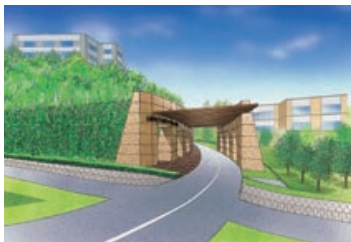
大学北門完成イメージ