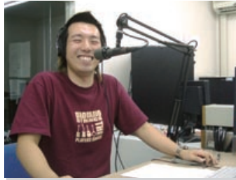
「FMでんでん」パーソナリティー

可児市と美濃加茂市を中心とした地域コミュニティFMラジオ局「FMでんでん」で僕はパーソナリティーをしています。今は、毎週金曜日、朝七時〜十時までの三時間「モーニングストリート」という生放送番組を担当しています。ニュース、