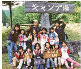
キャンプ・カウンセラー活動

この会では、名古屋市の小・中学生と長野県の「おんたけキャンプ場」に行きます。春にはネイチャー・キャンプ、夏にはメインとなる本キャンプがあります。夏のメインキャンプでは、子どもたちとご飯をついたり、魚捕りや虫捕りをしたり、キ