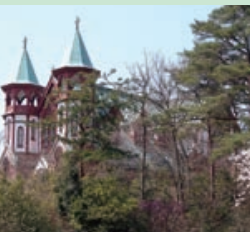
「博物館 明治村」（天山市内山）は十一月まで無休。 ☎ 056866710314

明治天皇が二階バルコニーから天覧相撲を楽しまれたという西郷従道邸は、家具調度をはじめ螺旋を描くようにしつらえられた階段までもが舶来製ですから驚きです。舶来品を手でできたのは一部の特権階級の人々だけのようですが、その一方で豪商の館、東松家住宅には逆に舶来品は一つもありません。