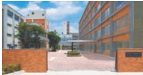
正面から見る新しい校舎