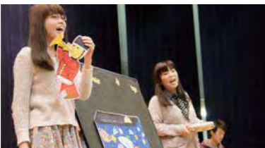
パネルシアターで会場を盛り上げる「わらべ」