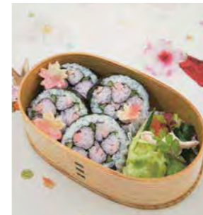
お寿司のさくらが咲きました