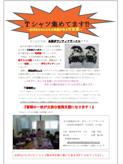
学内に貼られているTシャツ募集のポスター