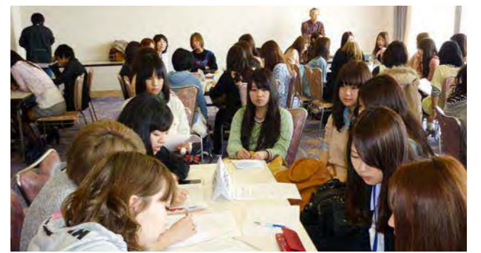
ゼミごとに行われていた上級生との交流会