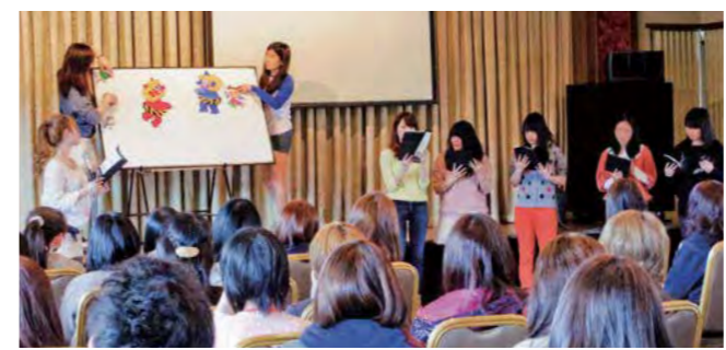
2年生によるパネルシアター