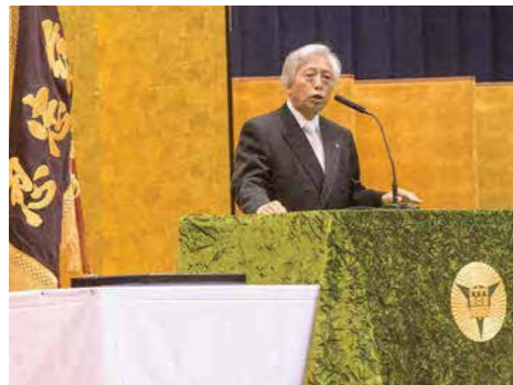
犬山商工会議所 日比野会頭による祝辞