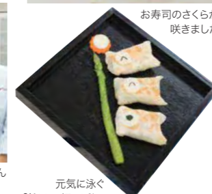
元気に泳ぐ「餃子de鯉のぼり」