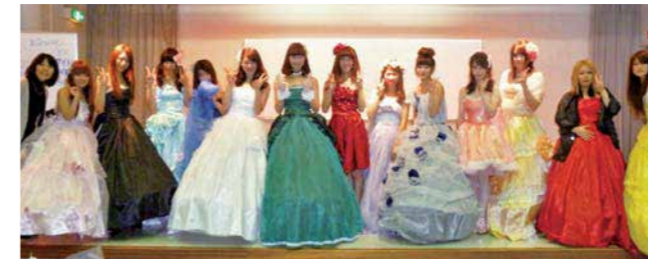
2年生光松ゼミのウエディングドレス製作発表