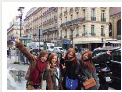
パリ・オペラ座近くで記念撮影

ドイツでは、ビール工場とローテンブルグへ行き、現地の学生との交流がありました。ビールは期待したほどおいしかったのですが、種類がいろいろ