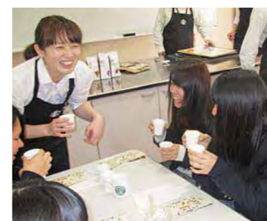
「Coffee Experience」 スターバックスコーヒー・ジャパン株式会社

今後、さらに内容の充実を図り、皆様に愛される高蔵、また公開選択講座にしていきたいと考えております。