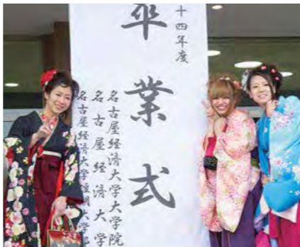
卒業式を終え笑顔で写真に収まる卒業生