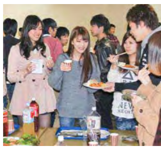
料理や飲物を手にパーティーを楽しむ

「新入生歓迎パーティー」が4月2日(火)15:00からコミプラにおいて開催されました。新入生ガイダンスが目白押しの中、「ようこそ名経へ!」という気持ちを込めて、学長をはじめ教職員、在校生が温かく歓迎しました。約300名の新入生が参加し、料理や飲み物を片手に、先輩・教職員や同級生と語り合いました。新しく始まった大学生活に期待と不安が入り混じっている新入生は、先輩・教職員と履修の仕方、大学生活、クラブ・サークルなどさまざまな話題で盛り上がっていました。また、和やかな雰囲気の中、緊張していた新入生同士も次第に打ち解け、学部を越えての交流となりました。