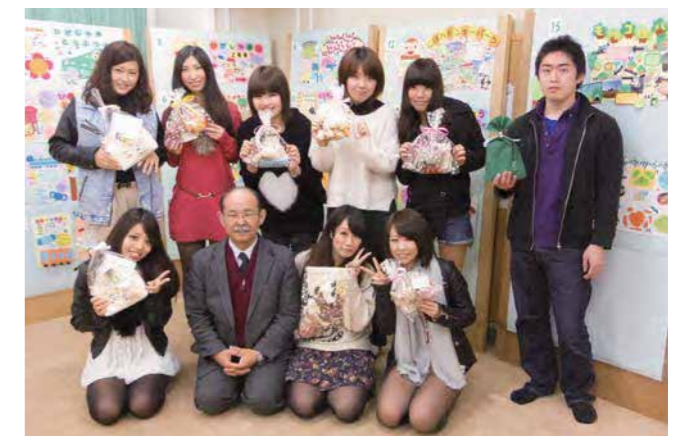
各グループの「遠足の計画」の展示の前で記念撮影