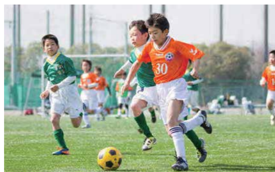
元気なプレイでグラウンドを駆けまわる小学生