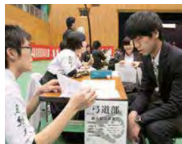
懸命に新入生を説得

4月1日(月)、入学式を終えたばかりの新入生に向け、クラブ&サークルのメンバー募集活動が学内のあちらこちらではじまりました。午後から体育館を会場に学生自治会主催の「クラブ・サークル紹介」を実施。ステージを使ってのPRタイムとクラブ・サークルごとにブースを設けてホットな新入生争奪戦が繰り広げられ、会場は元気なかけ声と笑顔があふれていました。