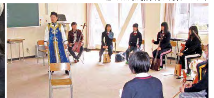
「馬頭琴を弾こう!」馬頭琴基金会