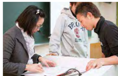
課題テストのチェックを受ける受講生

参加した高校生たちは緊張しながらも、4月から始まる新生活に向け、一足早い大学生気分を味わっていました。