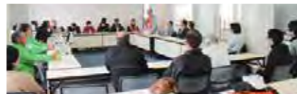
参加団体の意見交換会