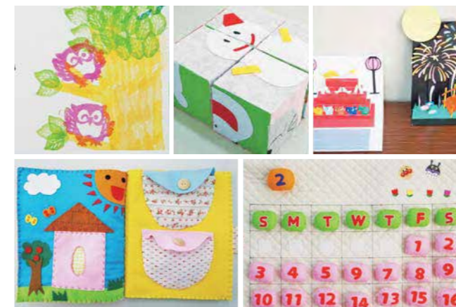
素材もデザインもバラエティに富んだ卒業作品