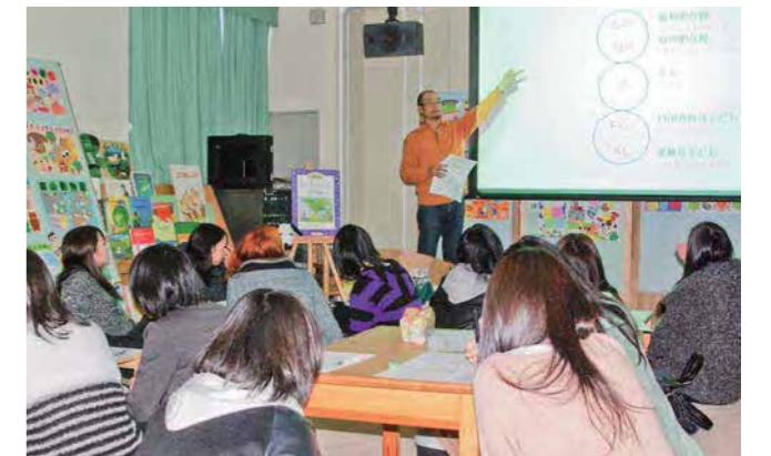
家接先生による「心理テスト」