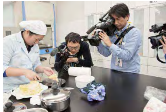
取材スタッフの接近に緊張しながら最後の仕上げをする学生