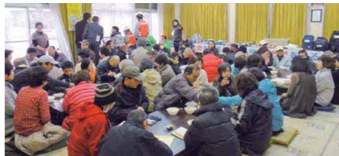
倉曾公民館での様子

*スタンドアロン型マップシステムとは、ネットが使えない環境でも各端末に蓄積されたデータを元に新たな情報を保存し、ネットが回復した後にこれを共有できるシステムです。