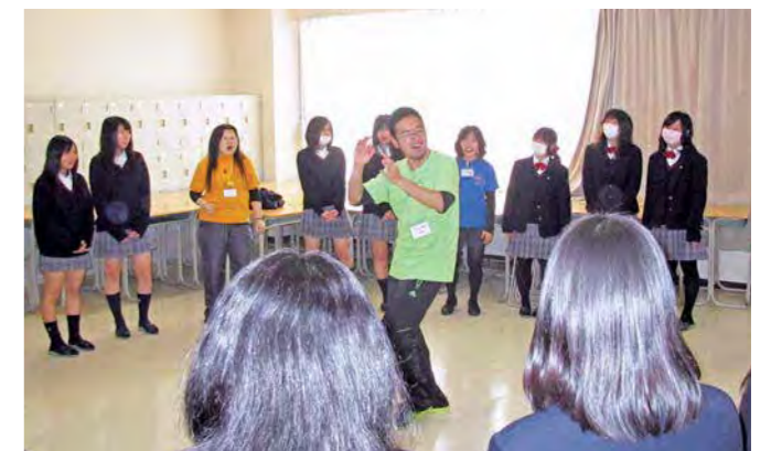
「ミュージカルを体験しよう」NPO法人コモンビート