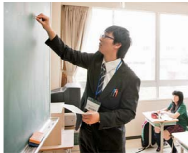
板書しながら生徒の意識を集中させる