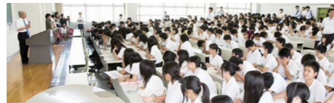
満席の講義室で学長の挨拶

講義を終えた生徒たちは、森の小道を通って総合グラウンドや武道場など広大なキャンパスを眺めながら体育館へ移動。先輩や教職員の見送りを受け、大学を後にしました。暑い日ではありましたが、未来の自分を想像し、進路意識を持つきっかけとなる行事となりました。