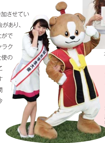
わん丸君と「第2回ご当地キャラ記念」JRA中京競馬場に登場

犬山観光協会と名経が連携! 平成26年度「犬山観光学生大使」大募集! (満18歳以上の名経現役女子学生)