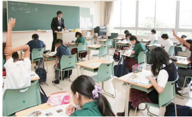
元気に手を挙げる生徒たち