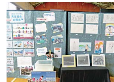
名経の学生による展示コーナー

9月14日(土)、15日(日)に開催された「楽田地区文化祭」に本学から漫画研究部、写真倶楽部、ボランティアサークルが参加しました。また、授業の一環として「共生社会の探究」で行われた活動の様子などを展示しました。