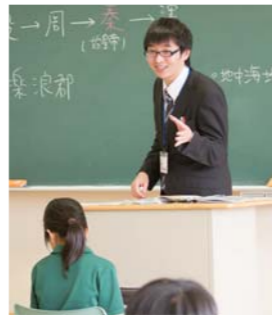
ポイントを解説し質問へ