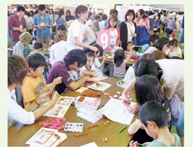
ハンドクラフトフェアの「ホビッチランド」ブースは子どもたちでいっぱい