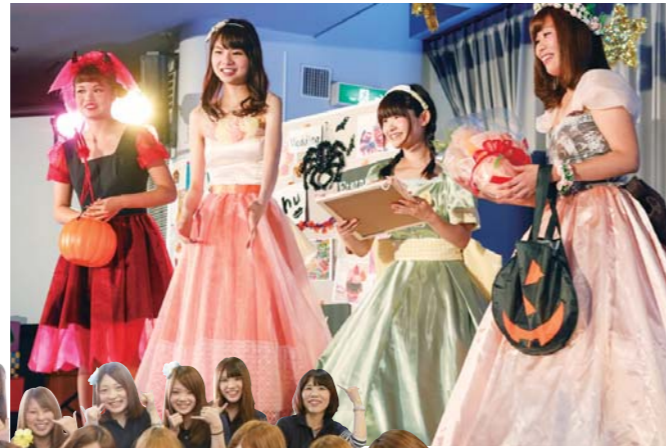
ステージを彩る 「ファッションショー」