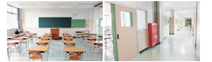
教室も明るくピカピカに 廊下のフロアもリフレッシュ

つつも、新しい快適性も取り入れ、生徒がより学校活動に集中できる環境をつくっていききたいと思います。