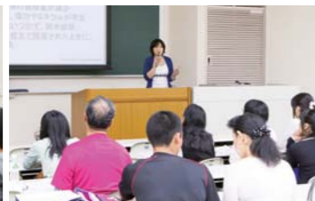
特別授業一部活応援宣言!