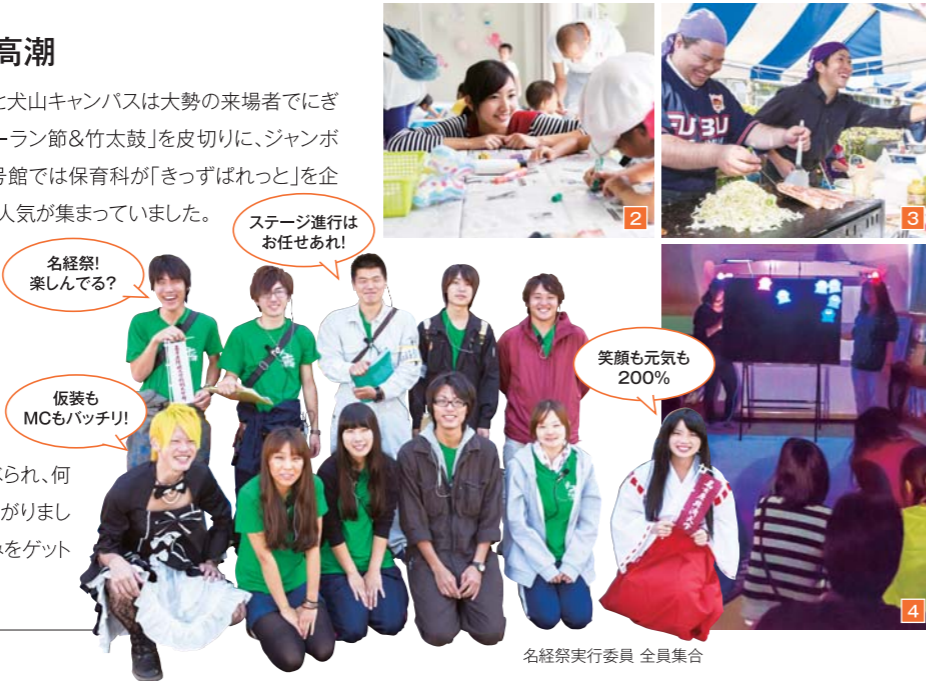
名経祭実行委員 全員集合

2日目は、プラスバンド部の演奏にはじまり、昼下がりの図書館では教員がバンド演奏を披露しました。ラストは、観客で一杯の「ピンゴ大会」。ステージには豪華景品が並べられ、何枚ものカードを手にあちこちで歓声が上がりが大いに盛り上がりました。一番人気のTVを手に入れた来場者や大きなぬいぐるみをゲットした小さな来場者も笑顔で記念撮影に応じてくれました。