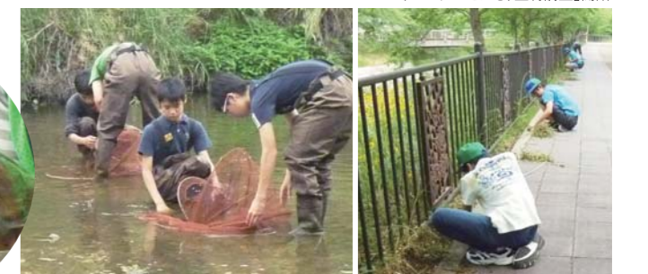
川につかり熱心に調査を続ける生徒たち 清掃ボランティア活動に汗を流す