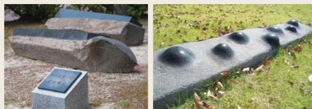
「時の記憶-12」犬山キャンパス音楽棟前 【大地から-09】(部分) 安城産業文化公園デンパーク

彫刻家としても活躍されている先生の作品は、犬山キャンパスのほか、小牧市民四季の森、安城産業文化公園デンパーク、名古屋市の金山総合駅南口ロータリーなどさまざまな公共施設にも設置されています。