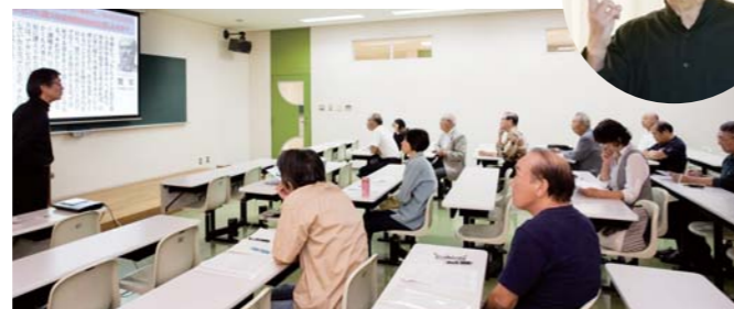
講義に引き込まれる受講生