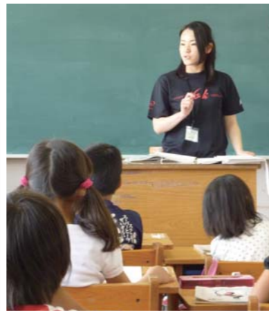
落ち着いて授業を進める