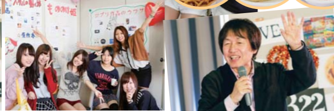
つぼイノリオさんの軽妙な トークショー!