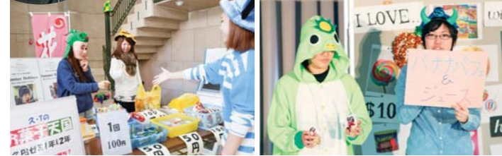
「お菓子天国」ジャンケンで駄菓子屋さん バナナパフェ&ジュース「MoGi Choice」でPR