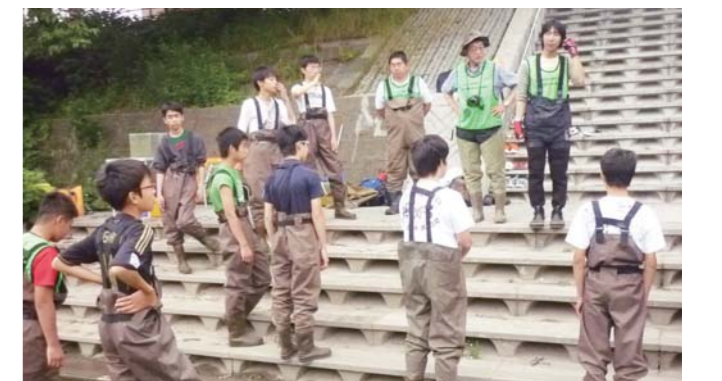
ウェーダーをはき「生物調査」開始

※日本カメ会議とは、カメの自然誌に興味のある研究者や愛好家が集まる日本カメ自然誌研究会主催のイベント。カメの現状や調査・観察の成果を報告する交流の場として毎年開催されています。