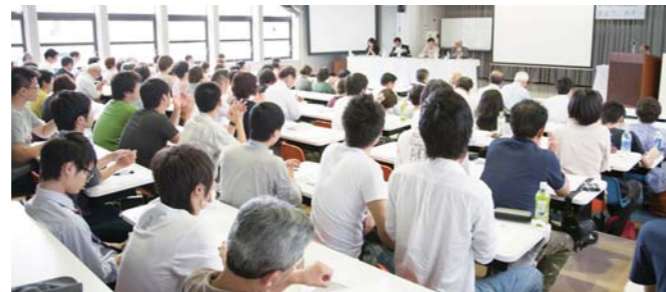
報告が終わり拍手をおくる講演参加者