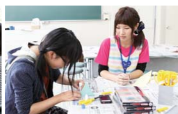
保育科「つくってあそぼう!」