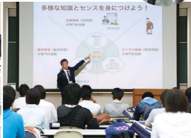
経済・経営・法学 3学部の新カリキュラムを解説