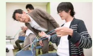
組紐「クテ打」に挑戦