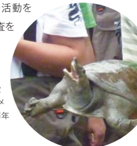
川底から巨大なカメを発見!