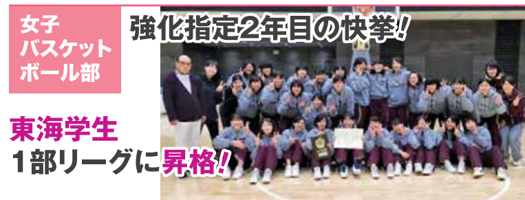
女子 バスケット ボール部

東海リーグ参戦1年目で昇格! 男子 6部リーグ 女子 5部リーグへ 東海学生個人戦 シングルス ベスト16 ダブルス ベスト8