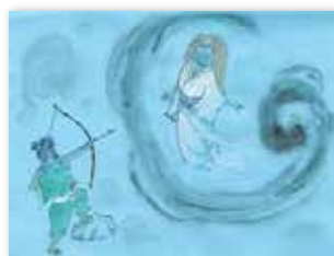
「山姥物語」の一場面