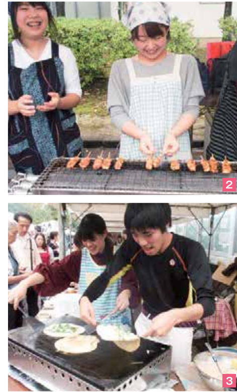
1 沖縄県人会が作る本場の「沖縄そば」 2 プリツと美味しい「焼き鳥」 3 「チヂミ」ナイスな返しを披露 4 タレ・七味マヨ・塩の3種の味「イカ焼き」 5 「地ビール」いろいろ 6 アジアンなパッケージ「インスタントカップ麺」