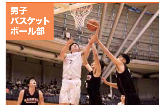
男子 バスケット ボール部