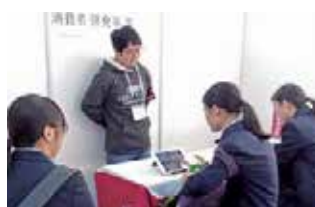
「デジタルクイズ」は女子高生にも大好評!