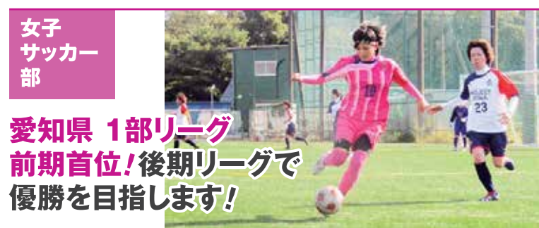
女子 サッカー 部