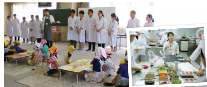
児童たちと対面し挨拶を交わす 「おにぎりの食材」検討会

犬山市が、小学生を対象に8月31日(木)に犬山保健センターにて朝食クッキングを実施しました。昨年度から、地域連携の一環として管理栄養学科の学生が参加しています。今回は22名と多くの児童が参加してくれました。学生は、朝食の大切さについて栄養教育を実施し、その後、子どもたちとともに「おにぎりづくり」を手伝いました。なごやかな雰囲気の中、行政における栄養教育への理解を深める体験となりました。(倉橋)