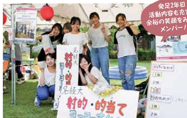
発足2年目 活動内容も充実し 余裕の笑顔をみせる メンバー!