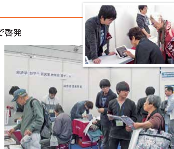
iPadを利用したクイズで盛り上がる「経済学部学生研究室地域政策チーム」のブース