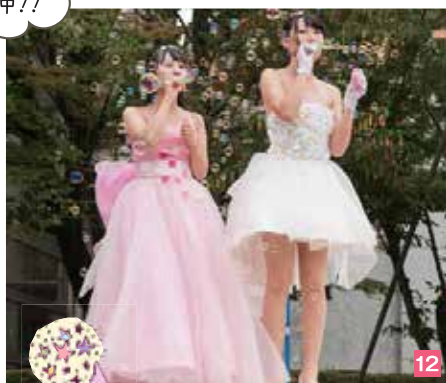
10 「どろぼうがっこう」何を盗んできたのかな? 11 「にじいろのさかな」きれいだね 12 ステージを華麗に彩る「ファッションショー」