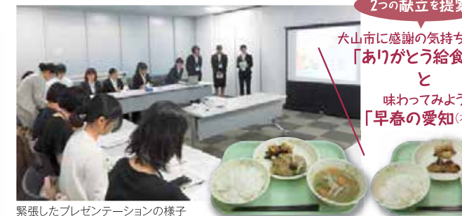
緊張したプレゼンテーションの様子

栄養教諭を目指す2年生が、学校給食の実際を学ぶ一環として「犬山の学校給食を考えよう」をテーマに献立作成に取り組みました。学校給食を生きた教材として捉え、地場産物や旬の食材を取り入れ、チームに分かれて献立を試作、検討しました。考案した献立は、学生が市内の栄養教諭や学校栄養職員の先生方にプレゼンテーションし、2月に犬山市内の小中学校で新たに導入されることになりました。(倉橋)