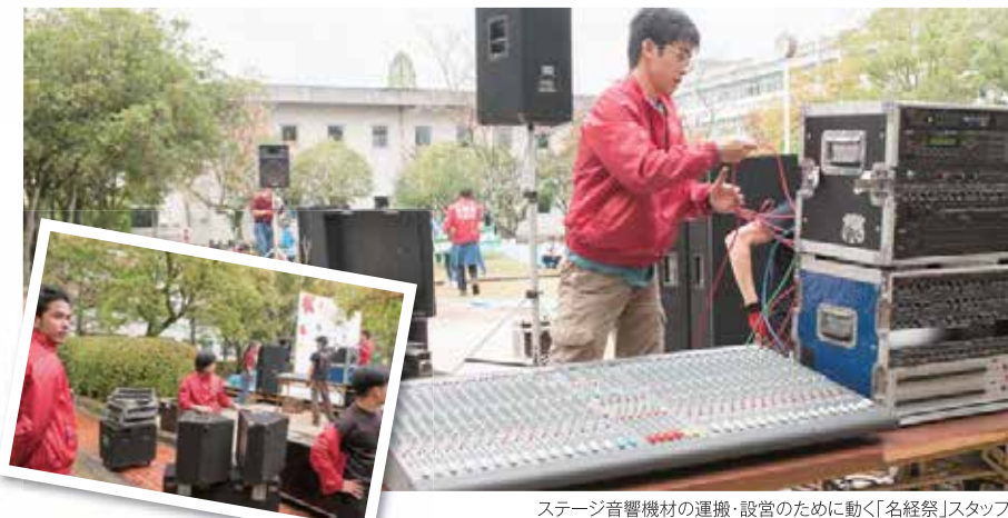
ステージ音響機材の運搬・設営のために動く「名経祭」スタッフ