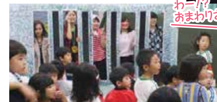
「どろぼうがっこう」の一場面「どろぼうさん、つかまっちゃった!」

『にじいろのさかな』と『どろぼうがっこう』の2冊の絵本を題材に劇を上演。春頃から企画を練って準備してきました。短大最後の大学祭に気負いもありましたが、子どもたちの楽しそうな笑顔に出会い、幸せな時間を手にできたことで今までの苦労も吹っ飛んでしまいました。