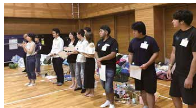
集まった子どもたちにゲームのルールを説明

2017」のプログラムの一部として開催し、本学国際交流室とNPO法人シェイクハンスとの共同事業として実施したものであり、ゲームの企画では犬山市役所経済環境部環境課のご協力もいただきました。