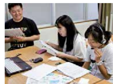
一語一句を大切に「音入れ」をするメンバー

「いろは」は、地域の子どもの向けイベントで活動を行ってききましたが、今回の電子紙芝居は学生たちにとって新しい試みでした。「山姥物語」は伝承話の電子画像を1枚1枚、動画編集ソフトを使ってつなぎ合わせ、編集し、アフレコで学生たちがナレーションを入れていくもの。初めは技術的に難しく、夜中まで制作をする経験もしました。しかし、完成した時には今までにない達成感を得られたようです。新しい試みに挑戦し、活動の幅を広げた「いろは」の活躍にこれからどうぞご期待ください! (塚本)