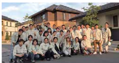
各事業部を見学し、モデルハウス前で記念撮影