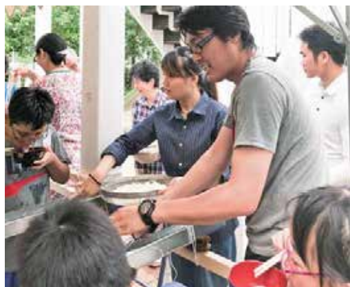
ゲーム終了後は子どもたちと「流しそうめん」を楽しむ

2017」のプログラムの一部として開催し、本学国際交流室とNPO法人シェイクハンスとの共同事業として実施したものであり、ゲームの企画では犬山市役所経済環境部環境課のご協力もいただきました。