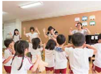
年少クラス「おゆうぎ」ががんばりました