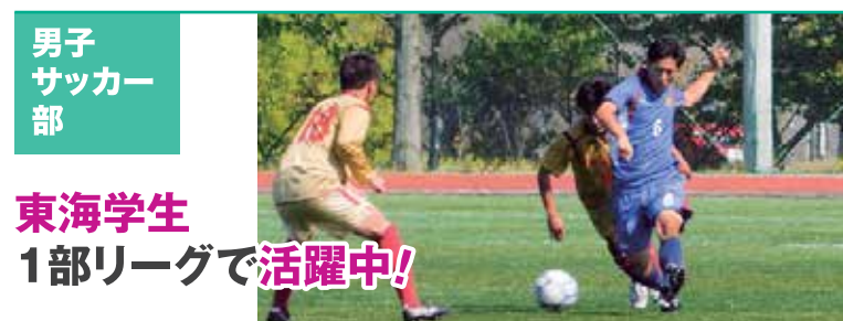
男子 サッカー 部