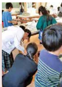
3年生図工の授業(楽田小学校)