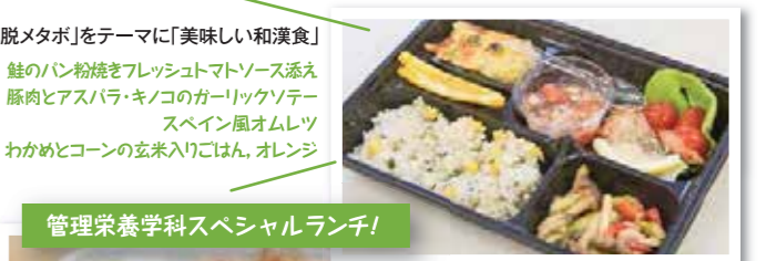
管理栄養学科スペシャルランチ!

▲エネルギー量:491kcal たんぱく質:28.4g、糖質:48.8g 脂質:13.4g、食塩:1.5g