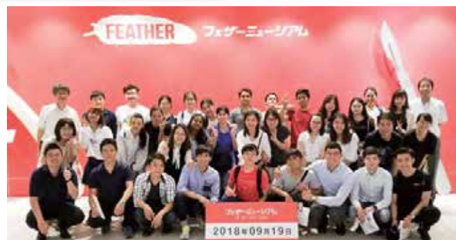
説明に熱心に耳を傾け質問をする(フェザーミュージアム)

説明を受けながら見学を行いました。優れた技術に触れる体験ができた留学生たちは目を輝かせ、積極的に質問を投げかけていました。