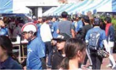
産業振興祭やハイキング、自転車散歩とのコラボで賑う模擬店