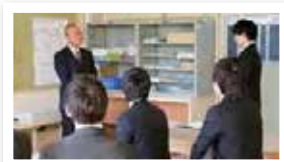
実習を終え学生から「お礼の挨拶」