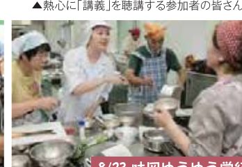
8/23 味岡ゆうゆう学級