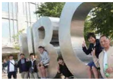
UBC(The University of British Columbia)モニュメントの前で

最初の3日間は、バンクーバーの市邸学園セミナーハウスに滞在し、事前課題「UBCにはなぜ学食がないのか?」を調査研究、チームに分かれて報告会を行いました。4日目からは、ホームステイ先から各自がELIへ通学し習熟別度別クラスにおける趣向を凝らした2週間の研修で英語力を鍛えました。