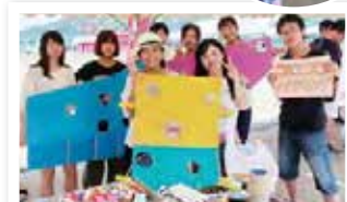
名経大ブース「コロコロバイキング」