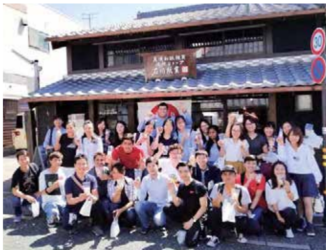
「ものづくり体験」石川紙業(体験ショップ)で記念撮影

9月19日(水)、「名経大グローバル人材プロジェクト」の一環で、留学生29名、教職員7名の合計36名が岐阜県的美濃市・関市・各務原市で「日本文化体験&企業見学」を行いました。ユネスコ無形文化遺産である美濃和紙を使った「ものづくり体験」では、留学生たちは担当者から手ほどきを受け個性豊かな作品を仕上げました。次に海外へ積極的な事業展開を行っているエーザイ株式会社の「内藤記念くすり博物館」とフェザー安全剃刀株式会社の「フェザーミュージアム」を訪問し、それぞれの会社概要・事業内容の