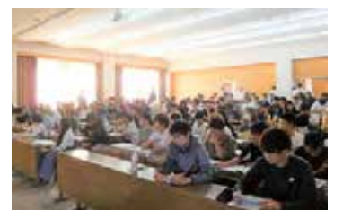
身近な選挙制度の話に熱心に耳を傾ける1年生