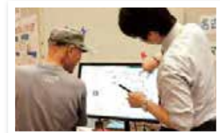
「地域情報の見える化」とその活用法を解説