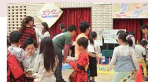
スライム&わなげゲームで賑わう「わくわく広場 in 名経大」