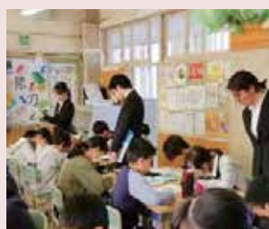
6年生算数の授業(本庄小学校)