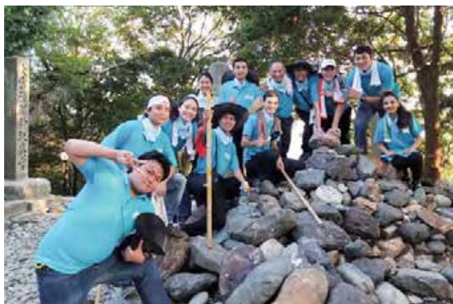
「尾張富士」に無事登頂! 石を奉納して記念の1枚