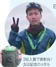
3位入賞で表彰台! 左は記念のメダル

夏季休暇中の研修で日本人が97%!の現実に、少しがっかりしましたが現地の学生はもちろん国立大学の学生との交流は刺激的で、