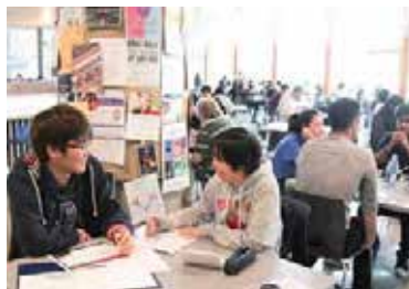
学生たちの憩いの場「ネスト」でレポートを作成