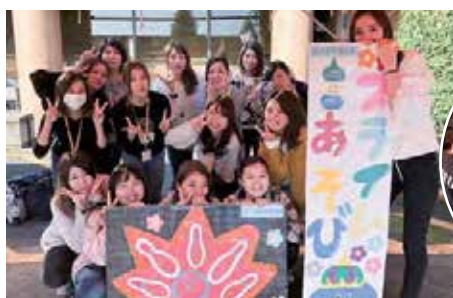
「ボウリングとスライムあそび」みんな笑顔で大盛況!