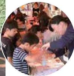
魔法の液体を勢いよくまぜると・・・?!