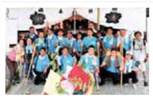
麓の「尾張富士大宮浅間神社」で祈願

登頂に成功した後は、1年間の健康と安全を祈願した「石」を拝殿前に奉納。参加者全員が最高の笑顔で記念写真に収まりました。