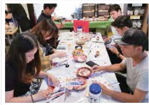
思い思いの作品作りに真剣に取り組む