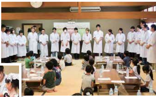
◀なごやかな雰囲気の中、児童と一緒に「サンドウィッチづくり」