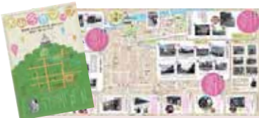
学生たちが苦労して完成させた「犬山今昔マップ」