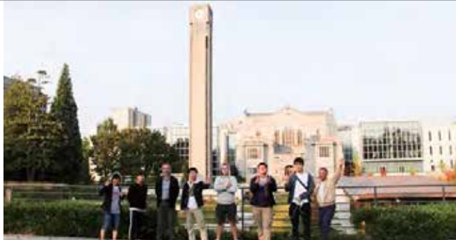
UBCのランドマーク「Irving K. Barber Learning Centre」