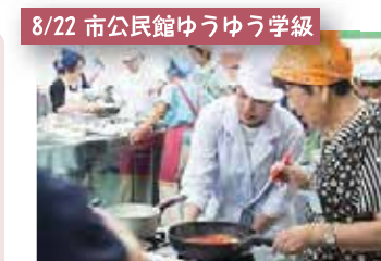
8/22 市公民館ゆうゆう学級