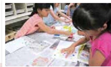
自由な発想で「フィンガーペインティング」に挑戦

小牧ジュニアセミナー(味岡市民センター・創作室) 7月 8日(日) ● フィンガーペインティング 10月28日(日)・1月26日(土) ● ピクトグラムを知る 12月15日(土)・22日(土) ● ハンドベル