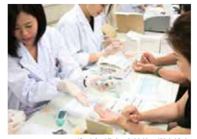
ヘモグロビン濃度・血糖値の測定検査

7月22日(日)のオープンキャンパスでは、日々の学びを実践へ繋げる「いきいき栄養・健康サポートプロジェクト」を開催しました。