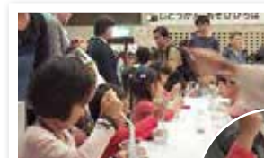
のび～る「スライム」できた!