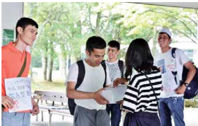
手作りの募金箱を手に「豪雨緊急災害支援募金」への協力を呼びかける留学生たち