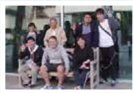
ELI前で記念撮影(前列左端)