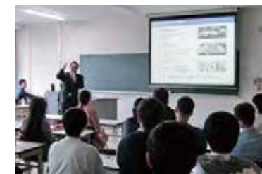
笠原 代表取締役社長からのお話

経営学部3年生の大曾ゼミ・山下ゼミでは、宝交通株式会社の支援をいただき、産学連携によるプロジェクト型学習をスタートさせました。